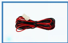
Cable de Poder