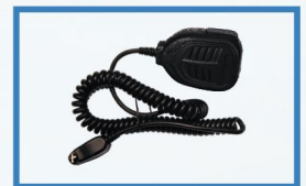
Micrófono de Mano