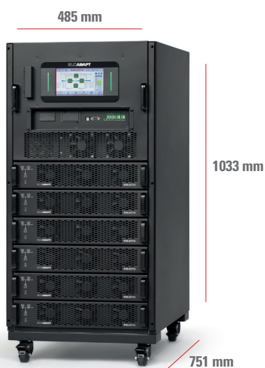
SLC-#/6 ADAPT 54 A