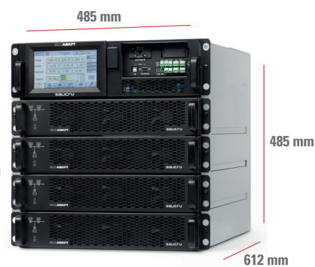
SLC-#/4 ADAPT 27 A