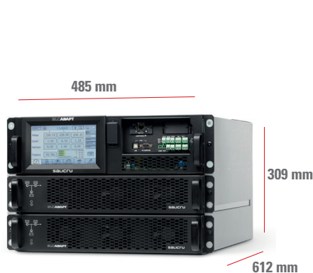
SLC-#/2 ADAPT 18 A