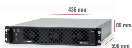
SLC ADAPT2 6 A SLC ADAPT2 9 A